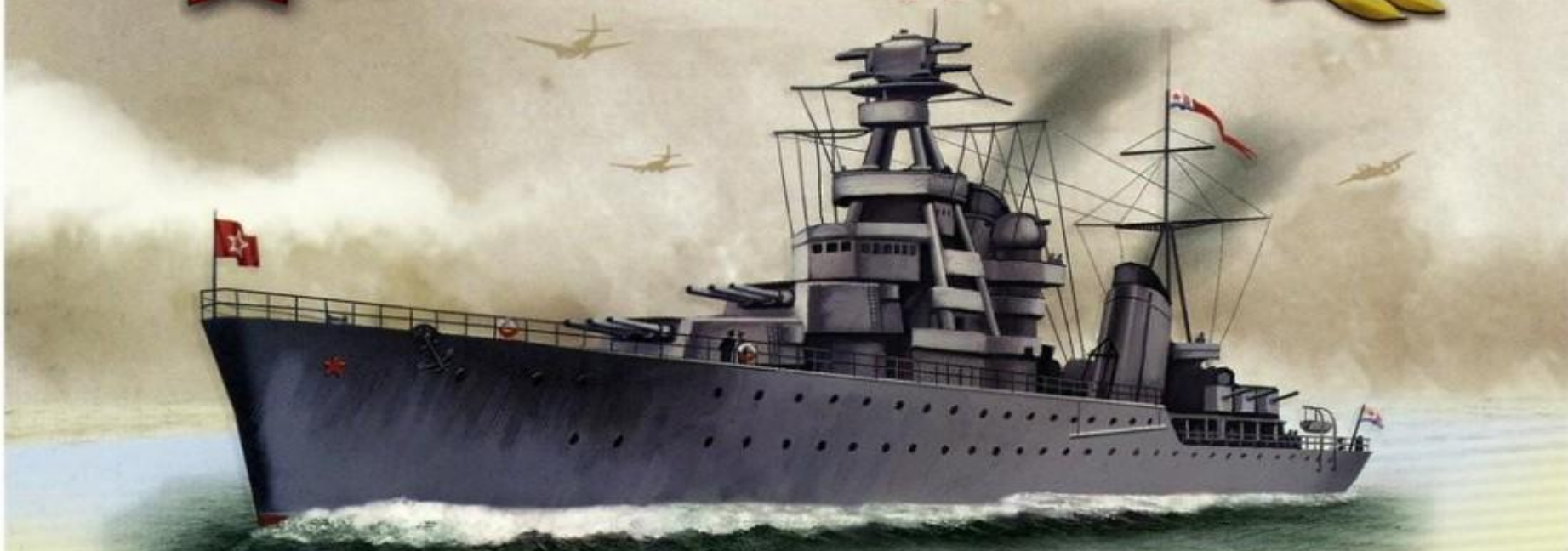
Краснознамённый лёгкий крейсер «Киров»

Водоизмещение — 9550 т; длина — 191 м, ширина — 17,7 м Вооружение: 9 x 180 мм, 6 x 100 мм, 3 x 45 мм и 14 x 37 мм орудий, 8 x 12,7 мм пулемётов, 2 x 533 мм торпедных аппарата, 164 мины, 2 бомбосбрасывателя, принимал на борт 100 якорных мин Скорость хода — 36 узлов, экипаж — 881 человек