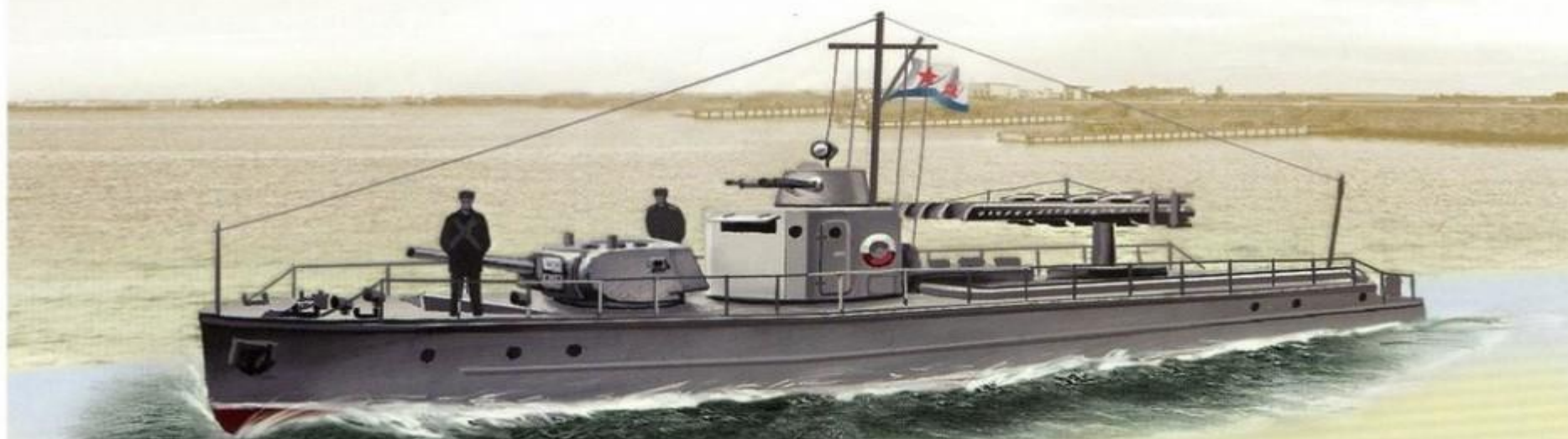
Гвардейский бронекатер БКА-75

Водоизмещение — 29,3 т; длина — 22,65 м, ширина — 3,55 м