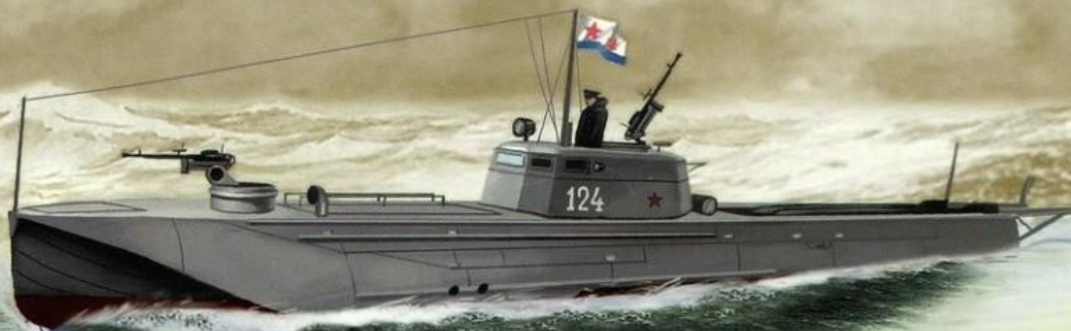
Гвардейский торпедный катер Г-5

Водоизмещение — 15 т; длина — 19 м, ширина — 3,3 м